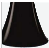
620/J/MA TESTA DI MORO DARK BROWN