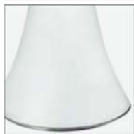
620/J/BI BIANCO WHITE